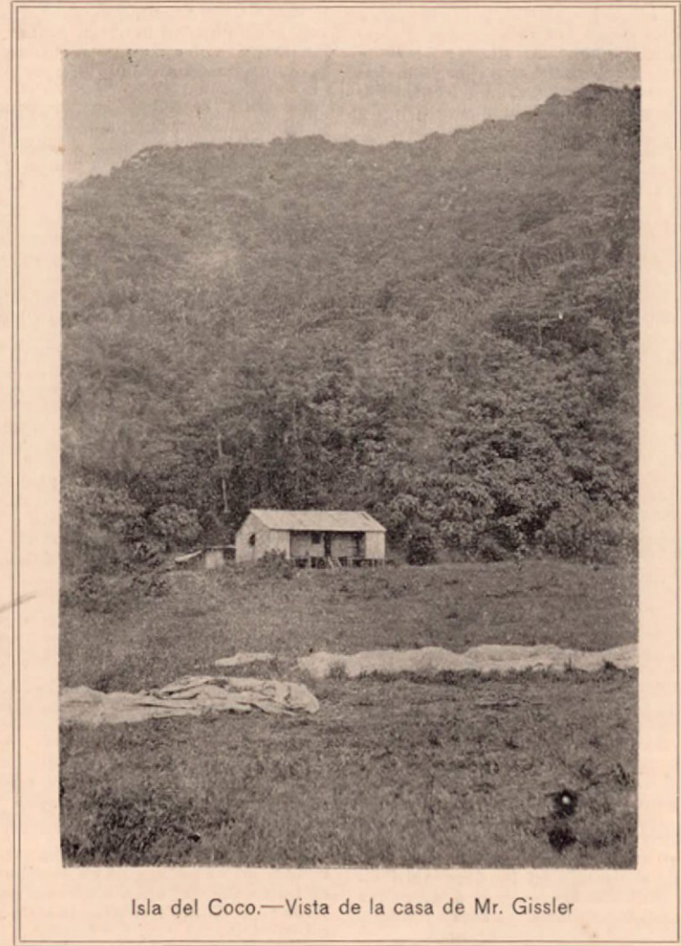
Isla del Coco.—Vista de la casa de Mr. Gissler

por medio de una palmada dolorosa en mala parte; ella á su vez, corresponde valiéndose de algún calificativo injurioso y manifestándole un profundo desprecio. ¿Quién al presenciar semejantes des-